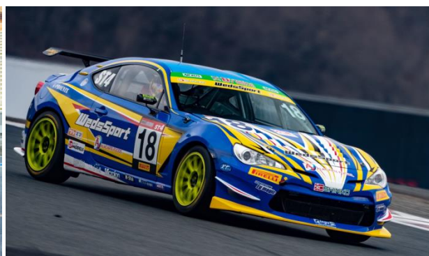
2019年3月2日 富士スピードウェイ TEST DAYにて撮影 (2019年度マシンカラーリング)