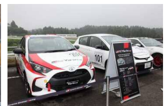
Yaris Cup Car