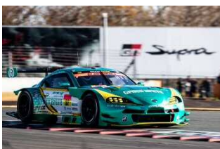
GR SUPRA GT

4つめのカテゴリーは、今年から始まるGAZOO Racing Yaris Cup。86 GB Camp のYaris Cup版である「Yaris GB Camp」を創設し、同レースへの参戦を希望するアマチュアドライバーをサポートする。マシンの整備やピット作業は店舗メカニックが行い、86 GB Camp 同様にGBドライバーのコーチングも受けられる。