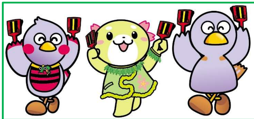
埼玉県公式マスコット 「さいたまっち」 坂戸市イメージキャラクター 「さかるん」 埼玉県公式マスコット 「コバトン」