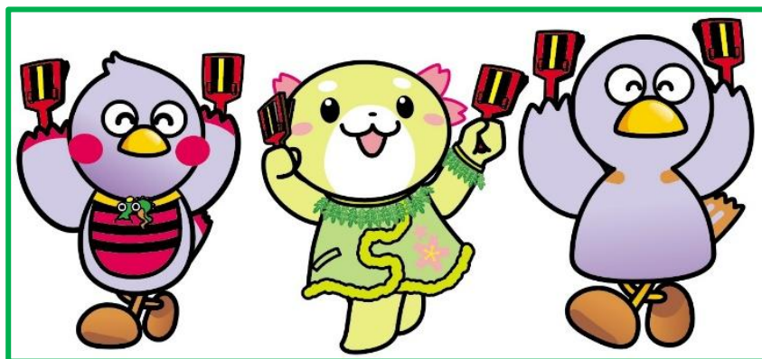
埼玉県公式マスコット 埼玉県公式マスコット 「さいたまっち」 「さかるん」 「コバトン」