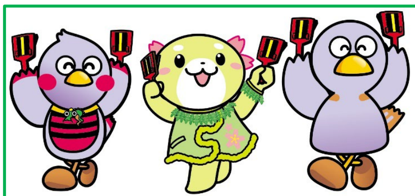
埼玉県公式マスコット 「さいたまっち」